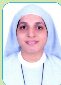
Sr Navya DDP Staff Nurse Gynaec Recovery