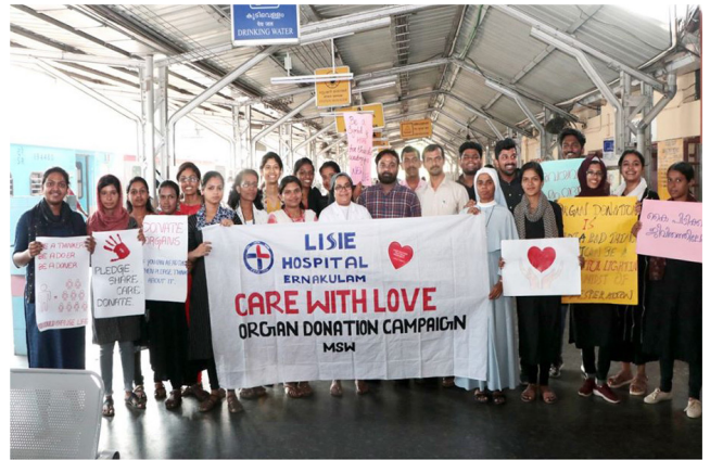
Organ Donation Campaign by MSW Department at Ernakulam North Railway Station, took place on 16 January 2020