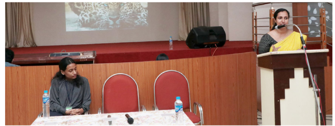
Seminar conducted by Rescue Research and Training Charity Trust for Lisie Medical & Educational students on 15 February 2020, based on the Topic MTP, PCPNDT, & the Health Implications of Non Traditional Sexuality.