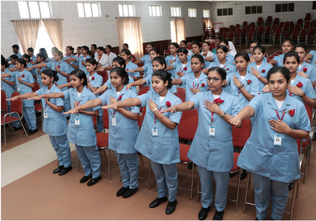
Oath taking ceremony of 18th batch BSc Nursing students took place on 20 February 2020.